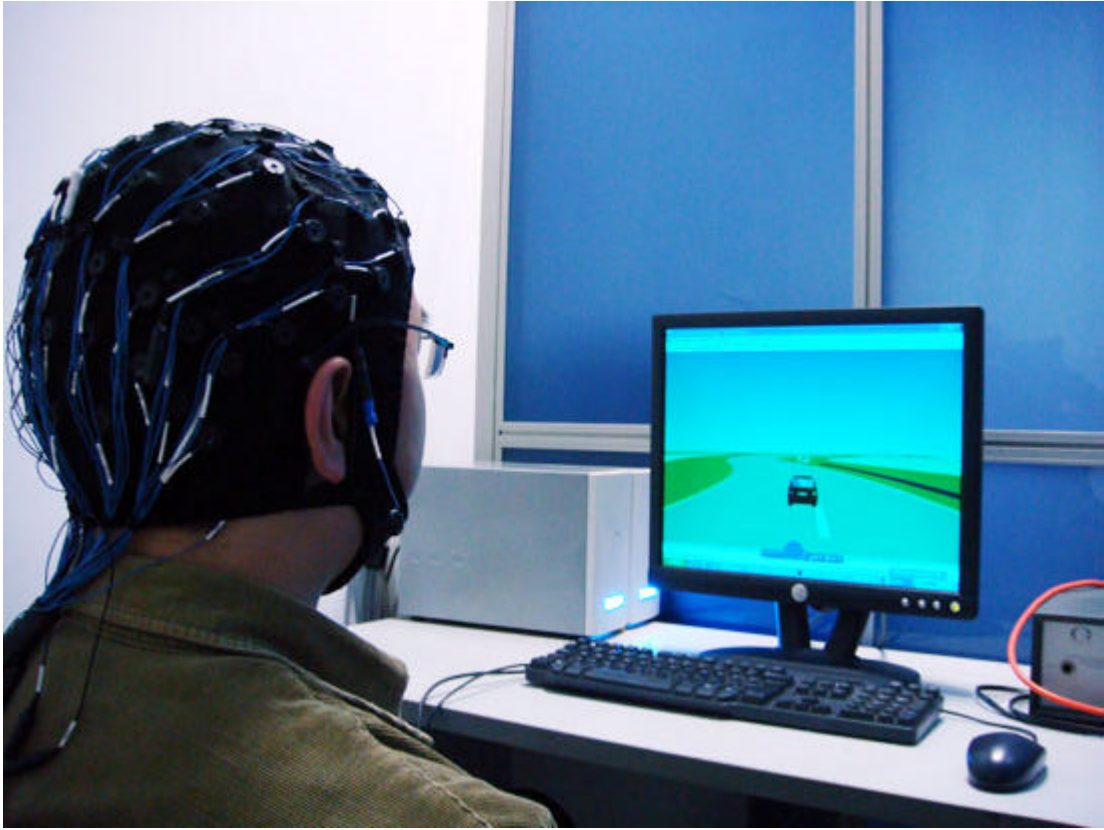
受试者正在用大脑信号驾驶汽车